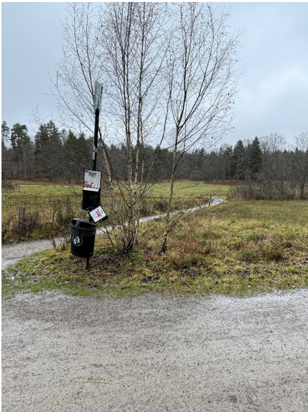
Bild 5. Befintlig grusgång över Långängen. Vy mot norr.