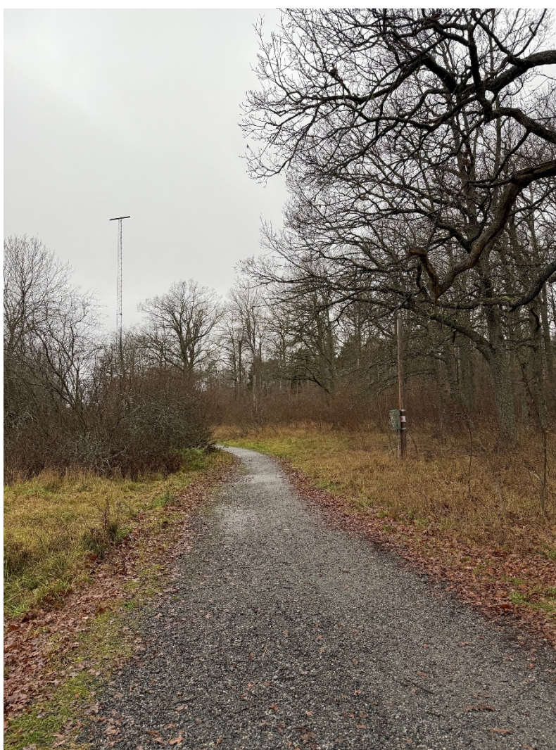
Bild 11. Befintlig grusgång, nära Huvudentré Tjädervägen mot vindskyddet. Vy mot väster.