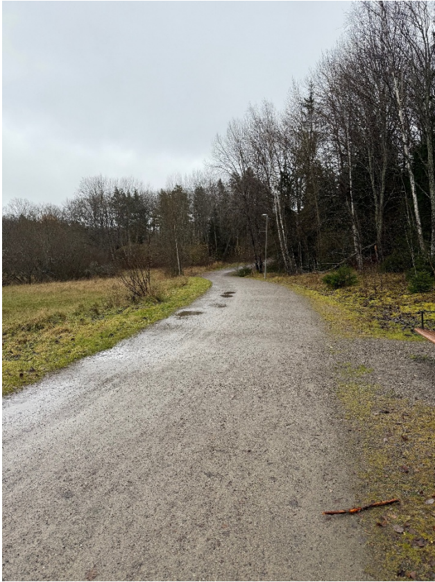
Bild 4. Gång- och cykelvägen på södra sidan av Långängen. Vy mot öster.