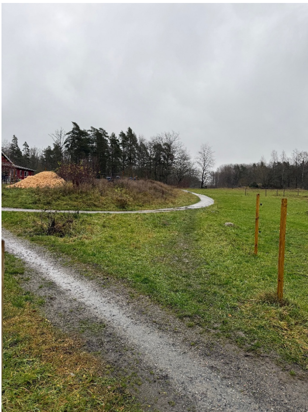
Bild 7. Vid Långängskroken och stallet. Vy mot öster.