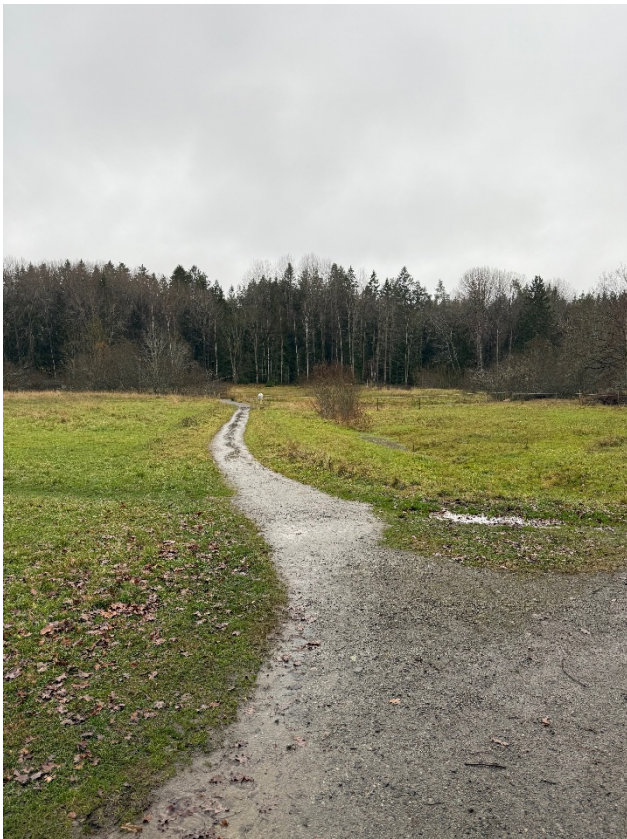
Bild 8. Befintlig grusgång över Långängen. Vy mot söder.