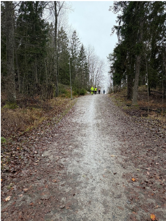
Bild 3. Gång- och cykelvägen på södra sidan av Långängen. Vy mot väster.