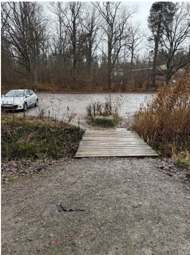
Bild 1. Gångbro vid p-plats och huvudentré Tjädervägen. Vy mot norr.