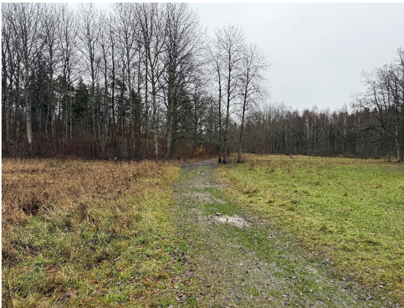
Bild 9. Vällfrekventerad stig mot vindskyddet. Vy mot öster.