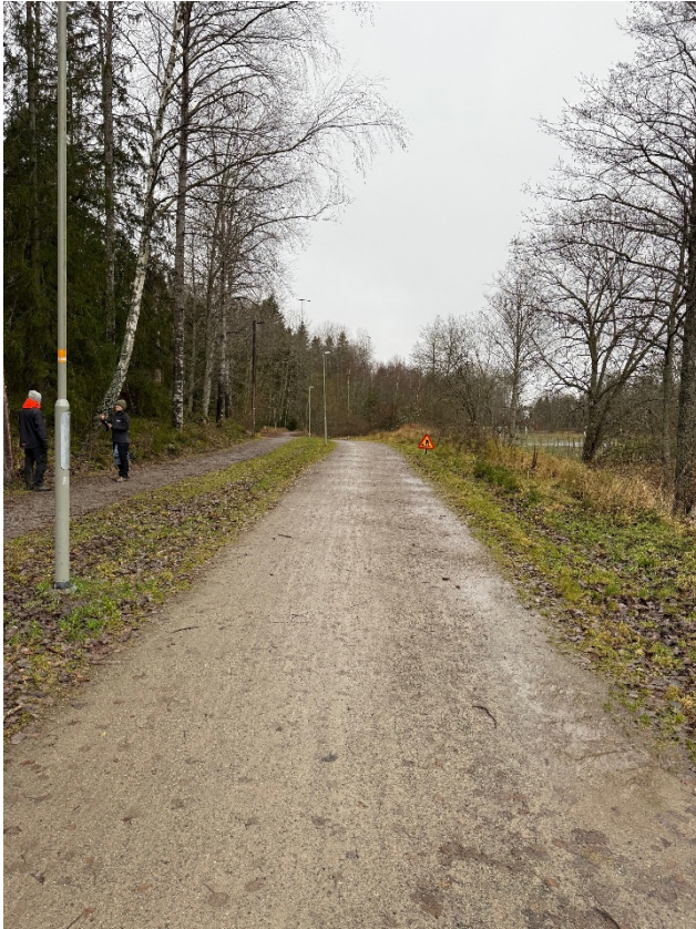
Bild 2. Gång- och cykelvägen på södra sidan av Långängen. Vy mot väster.