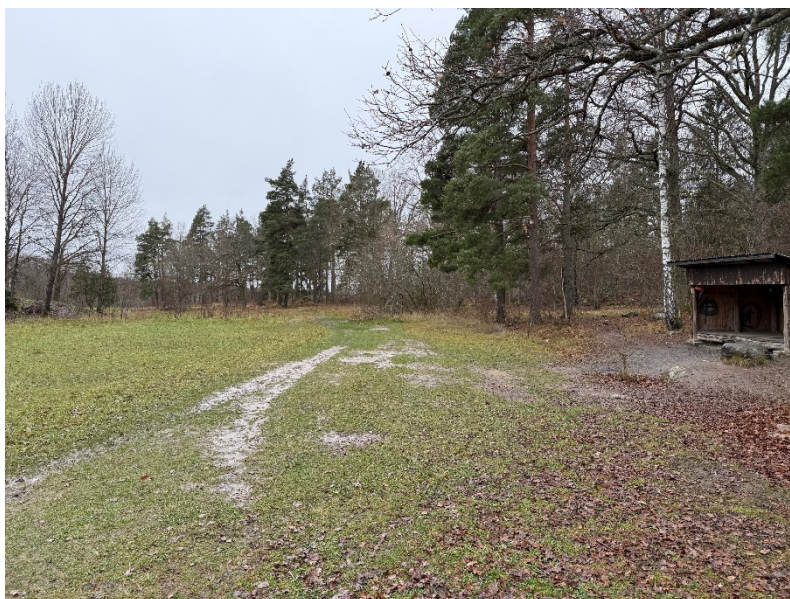
Bild 10. Vällfrekventerad naturstig förbi vindskyddet. Vy mot väster.