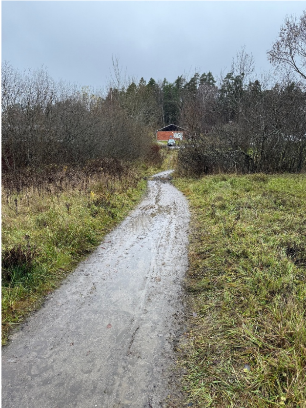
Bild 6. Utmed Långängskroken och ”bullerplanket”. Vy mot stallet och norr.